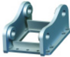
Pre priame uchytienie na čapy

Adaptérové platne sa používajú pre pripojenie hydraulických kladív a nožníc k stroju. Môžu byť osadené závesmi pre uchytienie na rýchlopínač.