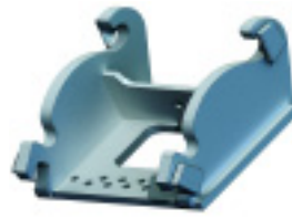
Pre pripojenie k rýchlopínaču CW