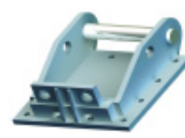
Pre pripojenie k rýchlopínaču Lehnhoff