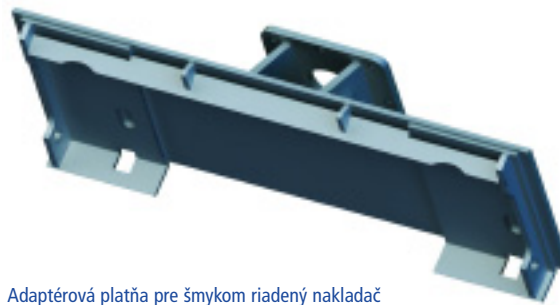
Adaptérová platňa pre šmykom riadený nakladač